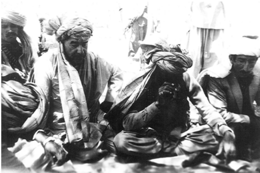
Генерал-лейтенант Д. Г. Шкруднев во время переговоров с главарем мятежников. Провинция Пактия. Август 1983 г.