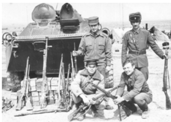
Офицеры РС ГВС с трофеями «Мармольской» войсковой операции. Март 1983 г.