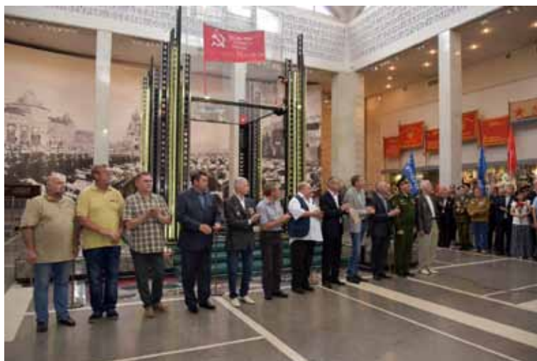
Послевоенная перекличка боевой роты советников (РС ГВС) 1 июля 2018 года. Москва. Центральный музей ВС РФ