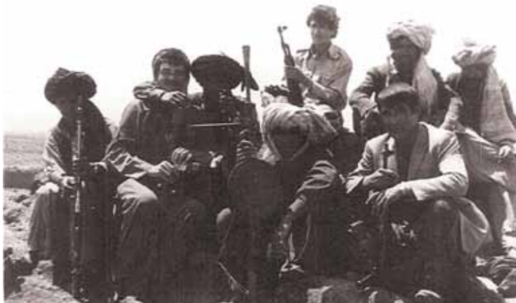
Фото на память после успешно проведенных переговоров с мятежниками. Провинция Пактия. Август 1983 г.