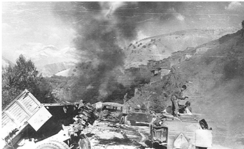
После налета афганских мятежников на советскую колонну (1983 г.)