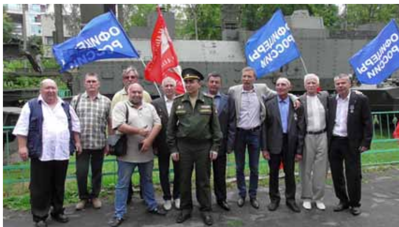
Встреча ветеранов РС ГВС. Москва. 2018 г.