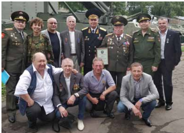
Встреча ветеранов РС ГВС. Москва. 2018 г.