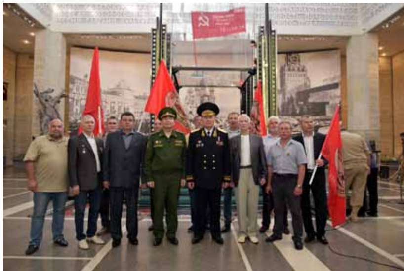
Встреча ветеранов боевой роты советников (РС ГВС). Москва. 01.07.2018