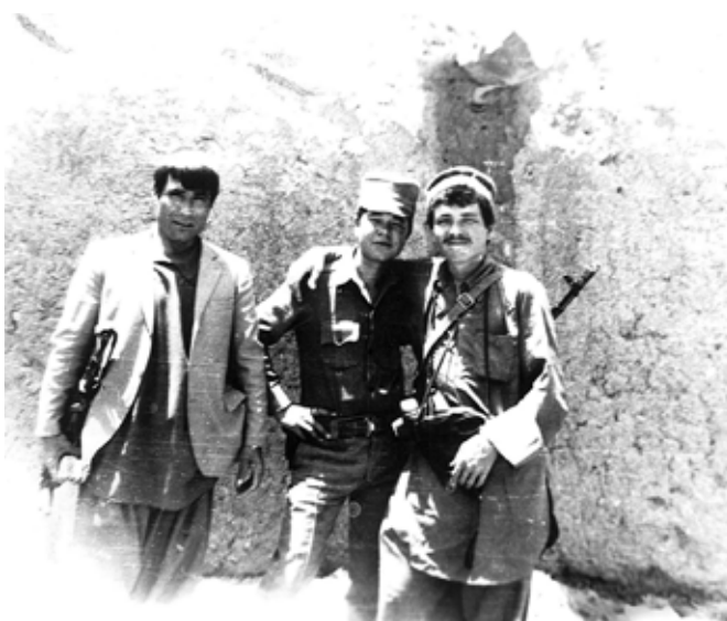
Фото на память перед переговорами с душманами (1983 г.)