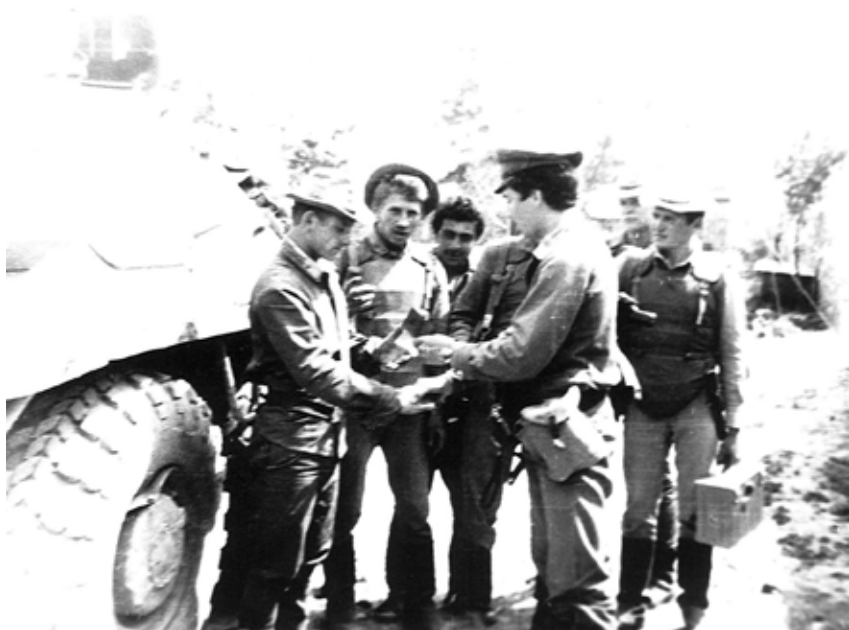
Вручение комсомольского билета после боя в Ургунском ущелье. Июнь 1983 г.